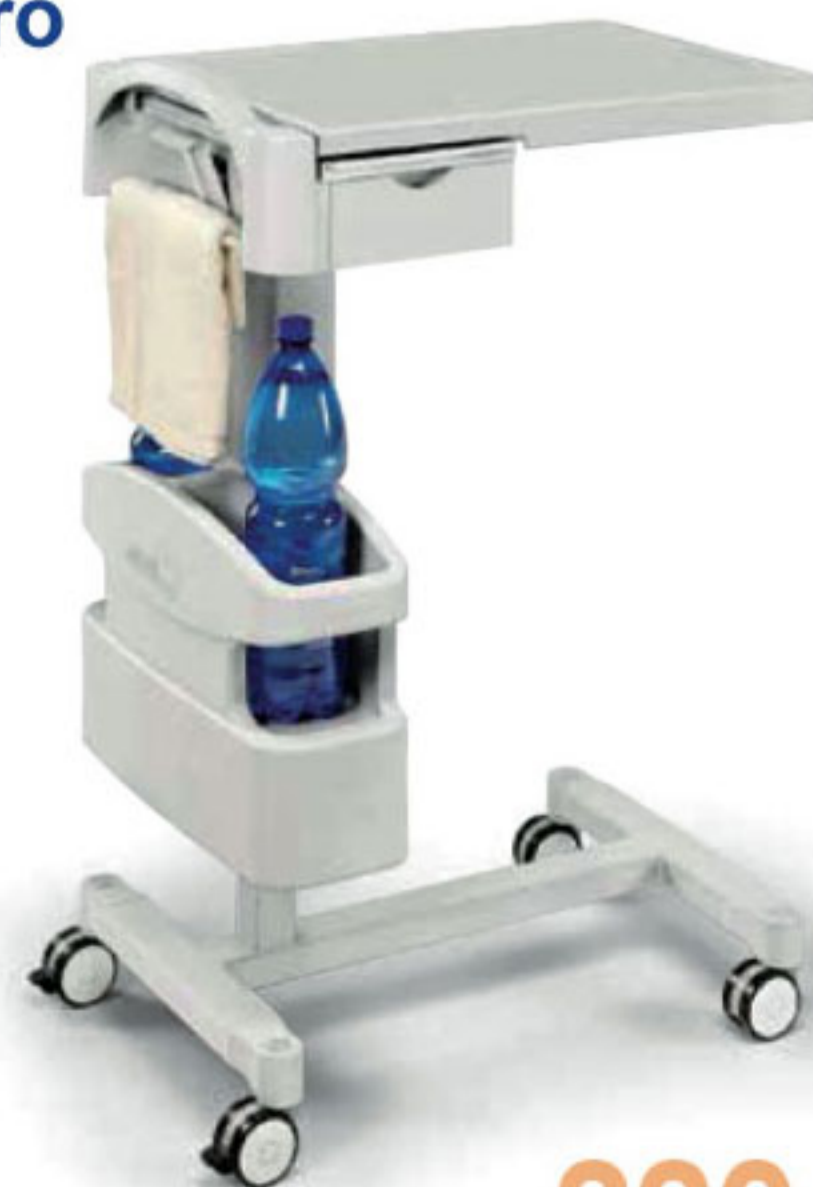
VANI Mesa Puente y Buró