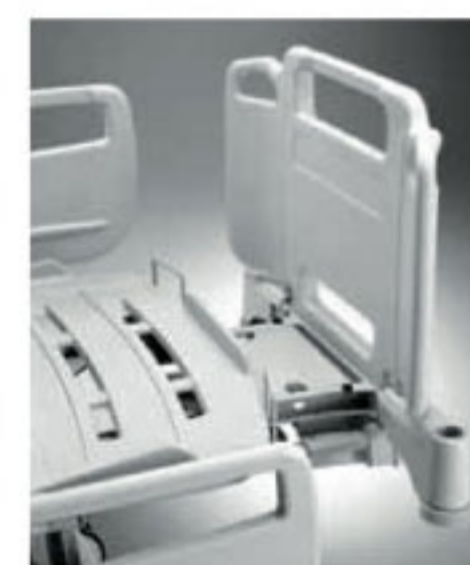
Alargador (prolongador) de la cama.