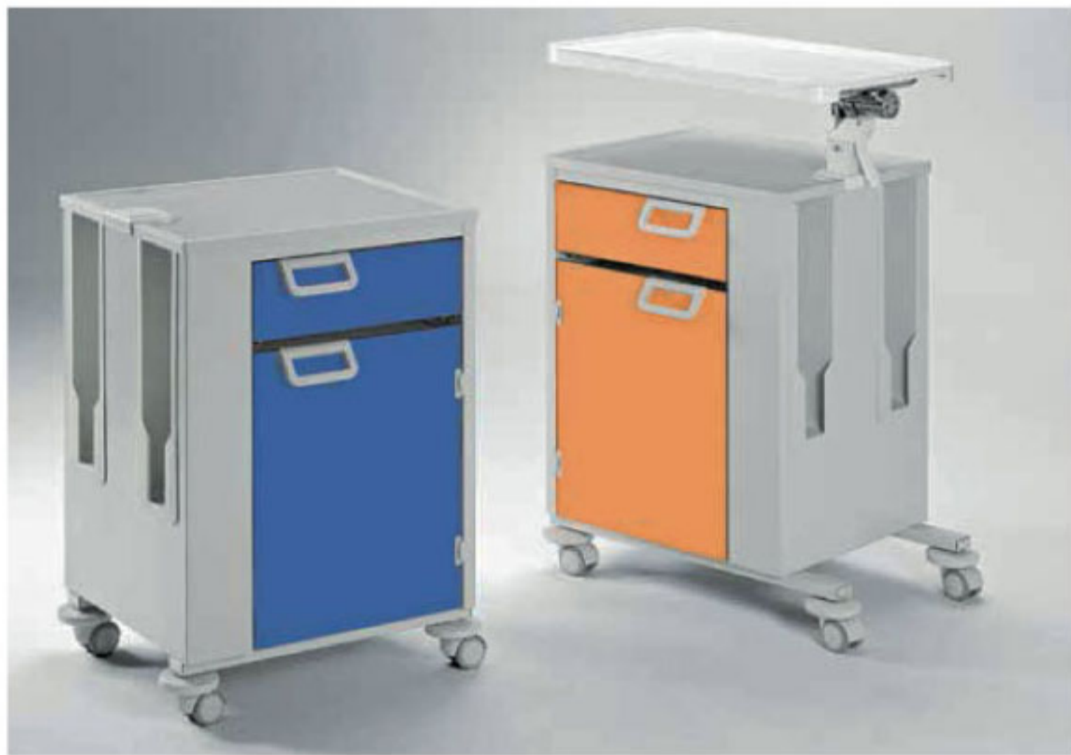
Buró serie 330800