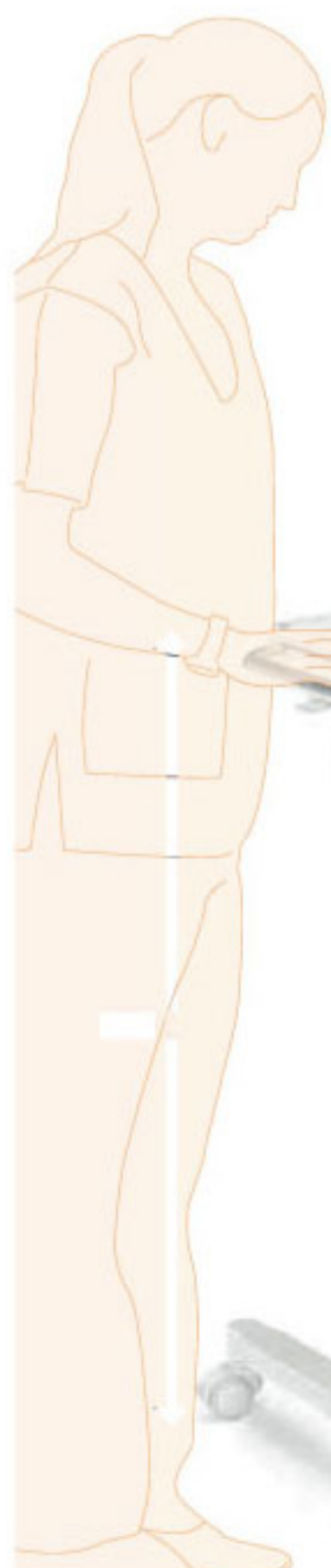
KOMO bi Mesa Puente de doble frente y Buró